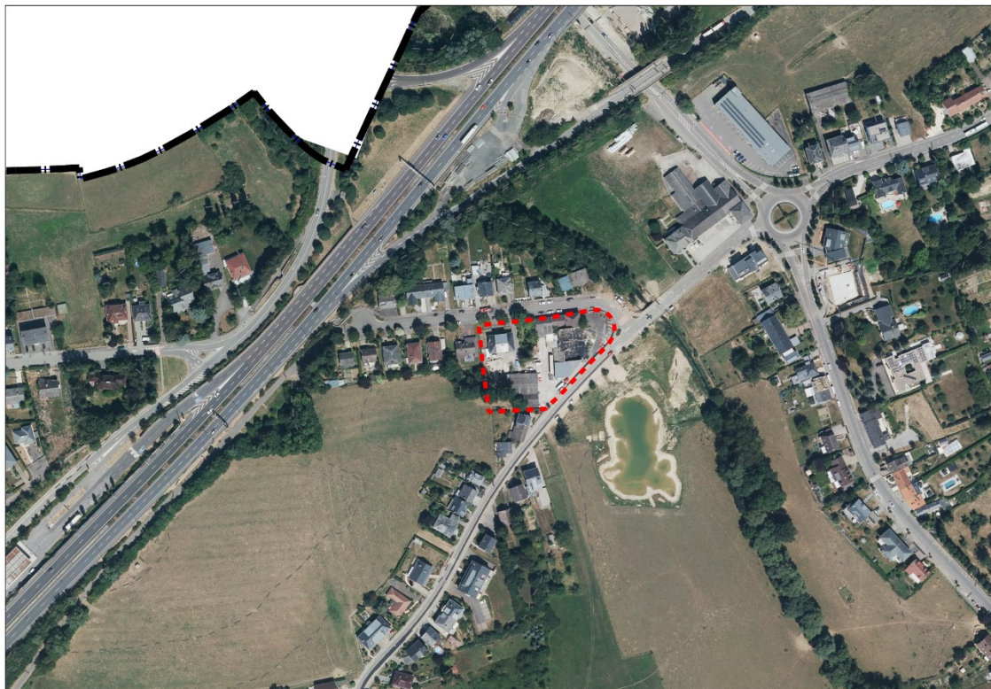
Abbildung 2 Verortung des Plangebietes (Luftbild)