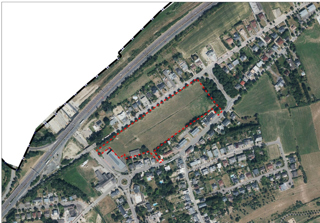
Abbildung 2 Verortung des Plangebietes (Luftbild)